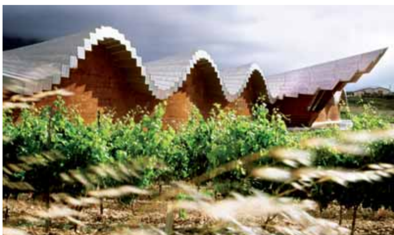
Cubierta de aluminio de la nueva Bodega de Ysios diseñada por Santiago Calatrava

La recuperación de esta boutique fue la excusa buscada para iniciar la gran bodega soñada. Con la idea de proyecto global museístico, se comenzó una primera fase que tiene al pabellón de visitantes, una insólita construcción modular metálica, como leí motive, junto con el patio de la bodega y demás accesos. La integración del nuevo edificio con la bodega primitiva se ha realizado a través de un entramado de líneas metálicas que construyen el nuevo pavimento del patio y sus accesos. A falta de varias salas de cata y otras zonas comunes, la obra aún no se ha inaugurado. Hasta entonces, "La Frasca" nos dará la bienvenida.