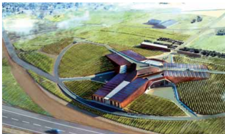
La estrella de tres puntas de Norman Foster para la bodega de Portia

pequeño pueblo de la Rioja Alavesa, entre sus casas e iglesia, le ha surgido un nuevo vecino. Un edificio que, como si de sus hermanas las cepas se tratase parece haber salido del mismo terreno. Engendrado por Marqués de Riscal y el gran arquitecto norteamericano Owen Gehry, su nacimiento ha revolucionado la arquitectura del vino.