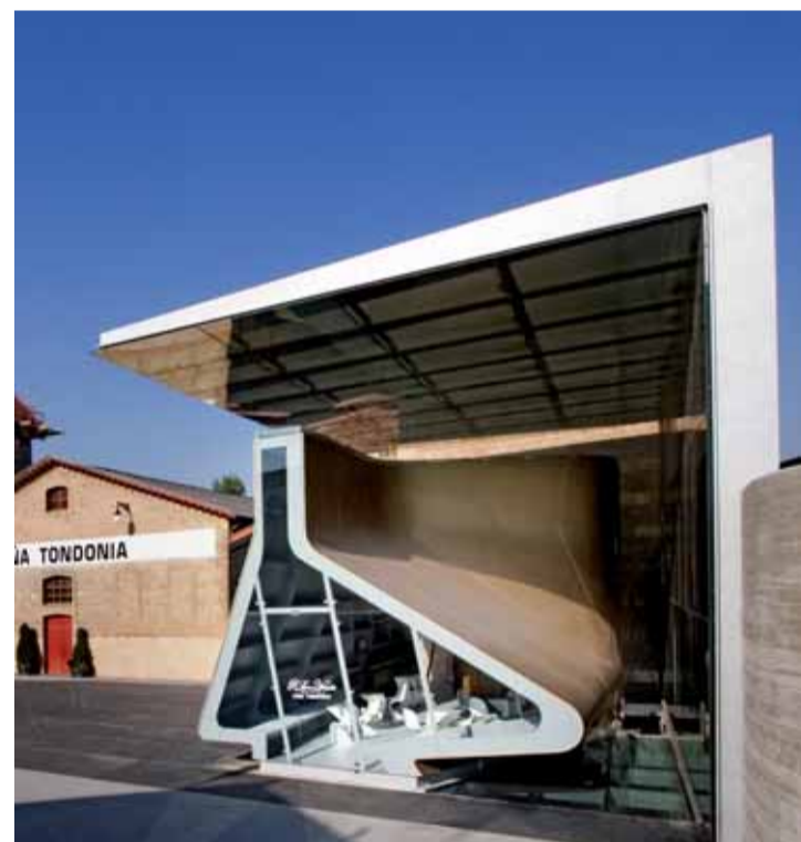
La recuperada boutique "La Frasca" de López de Heredia

Richard Rogers Partnership y Alonso Balaguer y Arquitectos Asociados son los encargados de su diseño. Con una superficie construida de casi 20.000 m 2 las nuevas instalaciones de Protos tendrán una capacidad para procesar un millón de kilos de uvas al año. La inversión ha sido de unos 24 millones de euros y se prevé que la obra esté finalizada este próximo verano. A partir de entonces, la arquitectura más vanguardista y la tradición bodeguera convivirán bajo la mirada imperturbable del impenable castillo de Peñafiel.