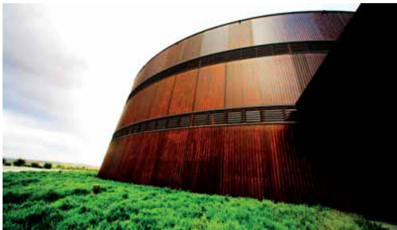
La espectacular tina revestida de madera de Viña Real

ción así como su sintonía entre arquitectura e ingeniería.