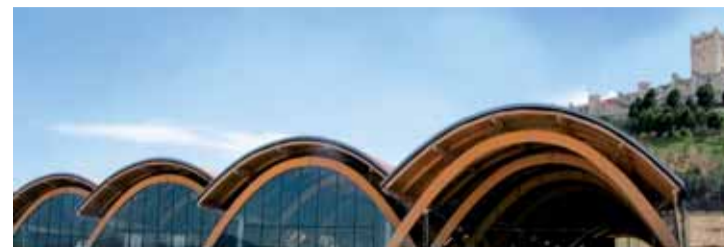
Impresionantes bóvedas parabólicas de la Bodega de Protos en la Ribera del Duero vallisoletana