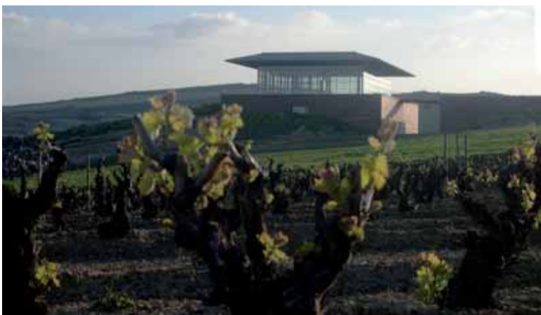
Viñedos y la caja de cristal de inspiración vasco-japonesa de Baigorri al atardecer

EL VINO NECESITA DE UNA EXCELENTE MATERIA PRIMA, TIEMPO, DEDICACIÓN Y CARIÑO. NO OBSTANTE, HOY EN DÍA, MUCHAS BODEGAS ENTIENDEN QUE LA ARQUITECTURA TAMBIÉN ES UN FACTOR DETERMINANTE EN EL PROCESO DE VINIFICACIÓN, ENVEJECIMIENTO Y DISTRIBUCIÓN DE SUS CALDOS. EN LOS ALBORES DEL SIGLO XXI, CADA VEZ SON MÁS LAS EMPRESAS VITIVINÍCOLAS ESPAÑOLAS QUE SE HAN APUNTADO A LA MODA DE CONSTRUIR LLAMATIVOS, MODERNOS E IMPONENTES EDIFICIOS PARA DAR VIDA, CUIDAR Y GUARDAR SU BIEN MÁS PRECIADO. OBSERVANDO ESTAS CONSTRUCCIONES ENCONTRAMOS VARIOS PUNTOS EN COMÚN. UBICACIÓN EN LUGARES SIMBÓLICOS, BODEGAS TIPO LAND ART O EMPLEO DE MATERIALES COMO EL HORMIGÓN, EL ACERO Y EL CRISTAL SON ALGUNOS DE ELLOS. EL ANTIGUO LAGAR Y LA RÚSTICA PIEDRA DE SU VIGA DE PRENSAR QUEDARÁN PARA EL RECUERDO. LA NUEVA ARQUITECTURA DEL VINO ACABA DE NACER.