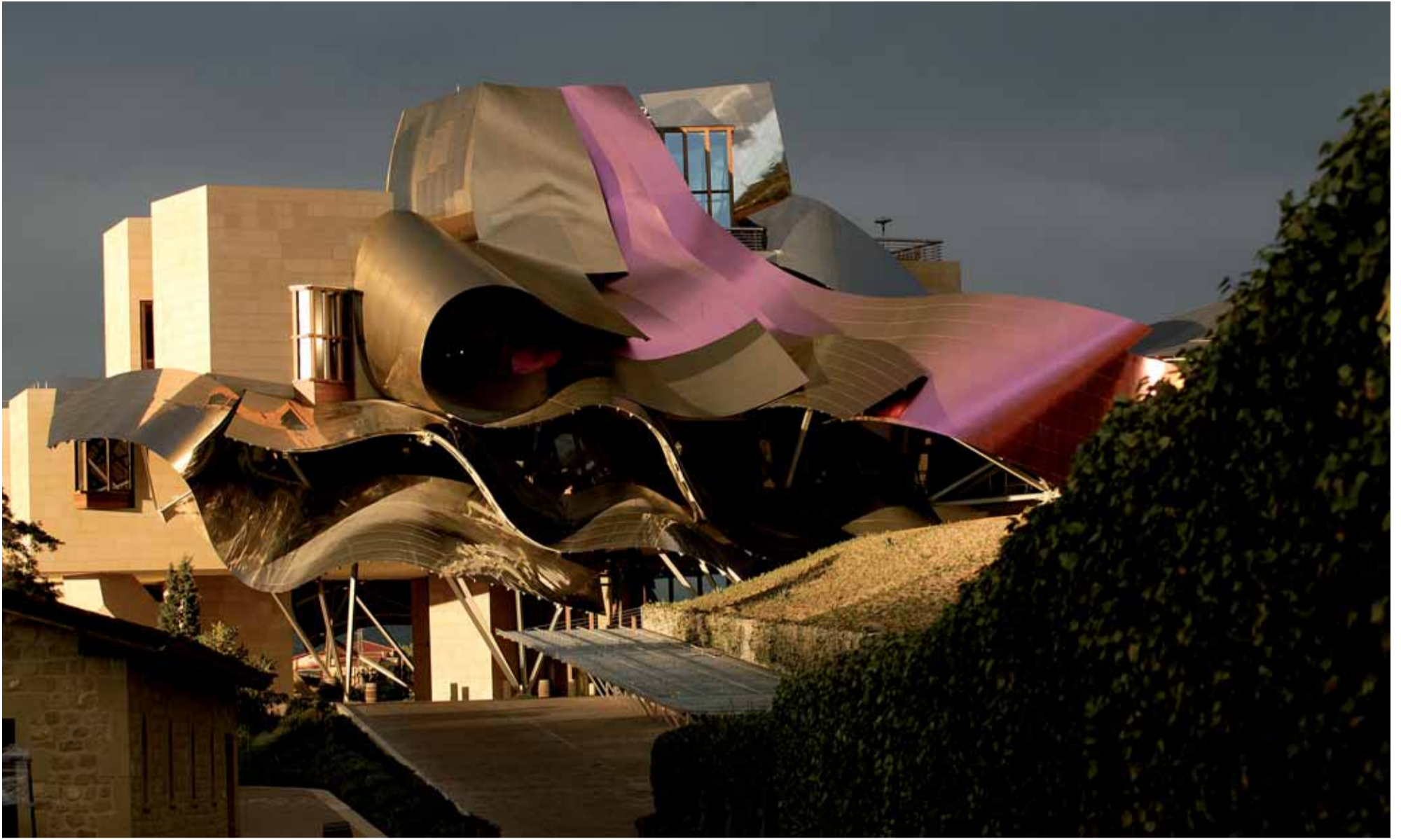
Un gigantesco lazo de titanio tornasolado corona el Hotel de la bodega Marqués de Riscal en la Rioja Alavesa

RIOJA Y RIBERA DEL DUERO CONSTRUYEN ESPECTACULARES BODEGAS DE INNOVADORES Y VANGUARDISTAS DISEÑOS