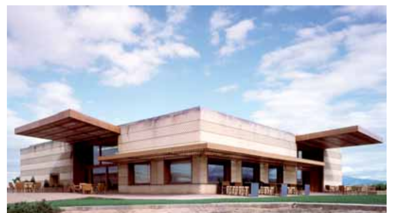
Las viseras y los restos fósiles sedimentados caracterizan la construcción de la Bodega de Juan Alcorta

el encargado del proyecto en 2001. Está situada en un altiplano elevado unos 100 metros sobre el valle del Ebro, con vistas panorámicas sobre toda la región. Tres aspectos aportan un carácter insólito a la construcción: integración en el lugar, carácter unitario y perfecta organiza-